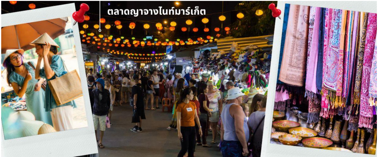
ตลาดญาจางไนท์มาร์เก็ต

ชื่อของฝากของที่ระลึก จนกลายเป็นแหล่งรวมนักท่องเที่ยว และวัยรุ่นในเมืองญาจาง ออกมาเดินเที่ยว และเลือกซื้อสินค้า กันอย่างคึกคัก