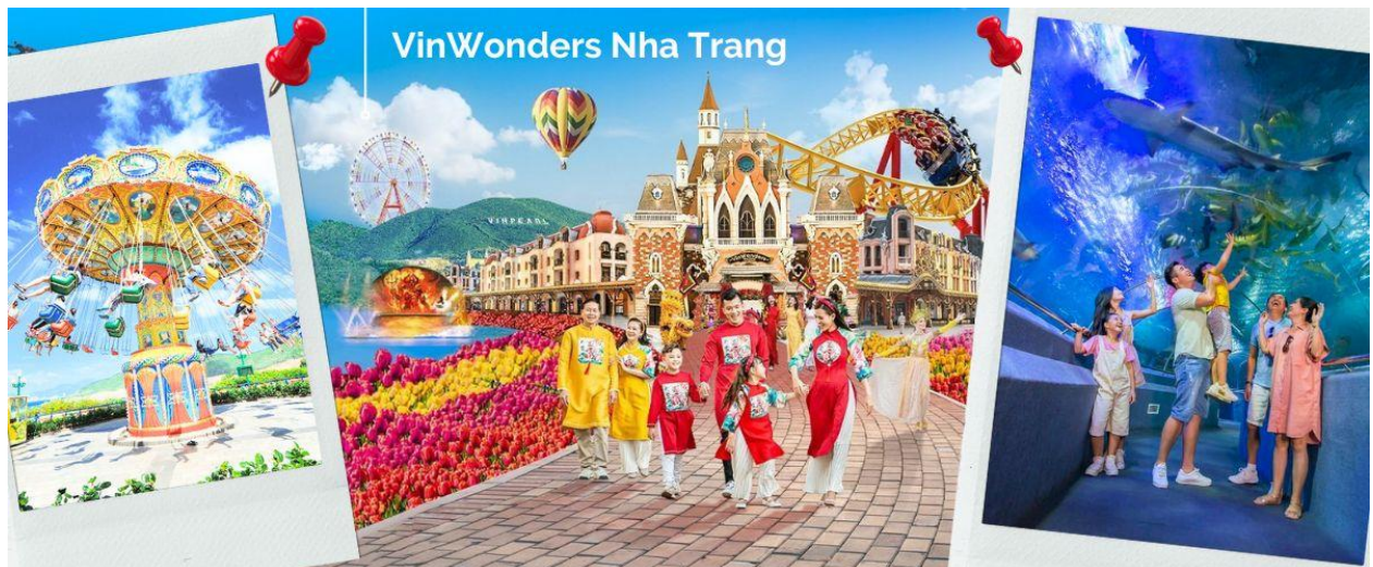
VinWonders Nha Trang

นำคณะขึ้นกระเช้าข้ามทะเล เพื่อข้ามไปยังเกาะ Hon Tre เที่ยวสวนสนุกวินวันเดอร์ (VinWonders Nha Trang) หรือ วินเพิร์ลแลนด์ ญาจาง (Vinpearl Land Nha Trang) ซึ่งเป็นสวนสนุกขนาดใหญ่ที่ตั้งอยู่บนเกาะ อีกฝั่งของเมืองญาจางใหญ่ถึงการจนเราสามารถมองเห็นได้จากฝั่งชายหาดเมืองญาจาง นับเป็นสวนสนุกที่มีชื่อเสียงจากทั้งชาวเวียดนาม และชาวต่างชาติ และเป็นอีก 1 กิจกรรมที่ไม่ควรพลาด เพื่อคุณมาเยือนเมืองญาจาง โดยแบ่งพื้นที่ออกเป็น 6 โซนหลัก 1.Fairy Land 2.Adventure Land 3.King Garden 4.World Garden 5.Sea World 6.Tropical Paradise (ค่าทัวร์รวมค่าบัตรและเครื่องเล่นเรียบร้อยแล้ว)